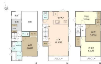
3～11号棟間取り (奇数号棟は反転タイプ) 土地 65.00㎡・建物 100.18㎡