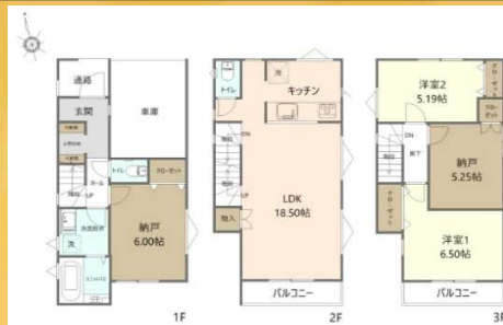
3~12号棟間取り (奇数号棟は反転タイプ) 土地 65.00㎡・建物 100.18㎡