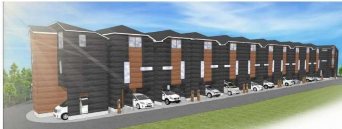
【現地外観イメージパース】

※上記お支払例は横浜銀行 変動金利 35年間 借入額2,990万円 優遇金利適用後のお支払額です。詳細は横浜銀行のHPを参照。