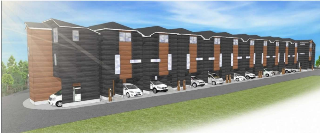
現地外観イメージ

設備 複層ガラス 食器洗乾燥機 温水洗浄便座 浴室乾燥機 ベタ基礎 24時間換気