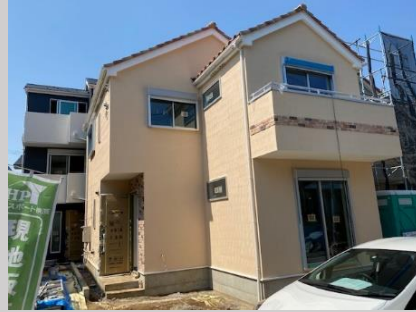
★ 2号棟 ★