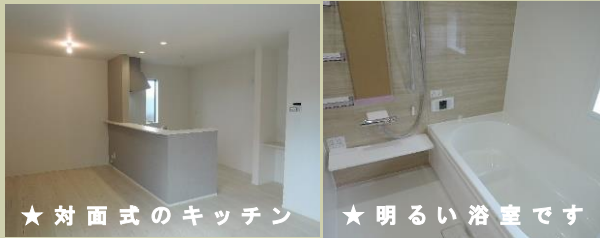
★ 対面式のキッチン ★ 明るい浴室です