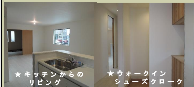
★ キッチンからのリビング