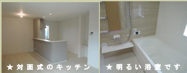
★ 対面式のキッチン ★ 明るい浴室です